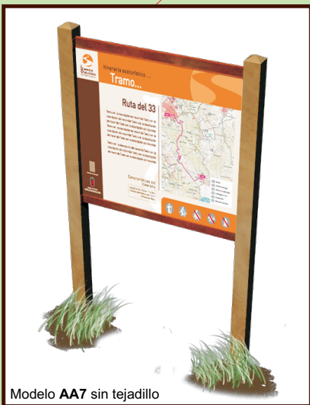
Modelo AA7 sin tejadillo

El montaje in situ con tornillería antivandálica es fácil siguiendo las instrucciones que se adjuntan.