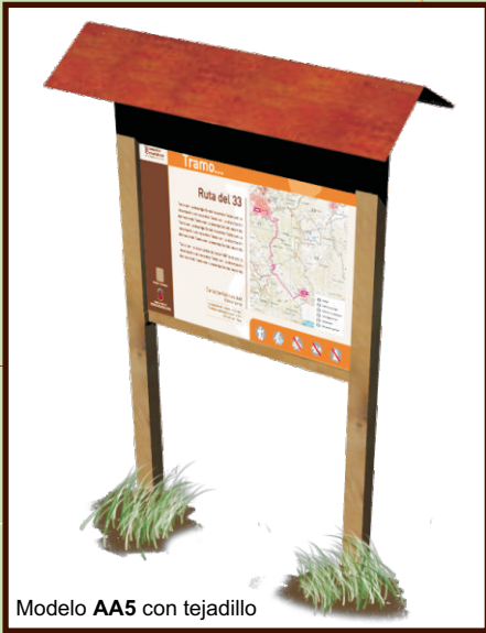
Modelo AA5 con tejadillo